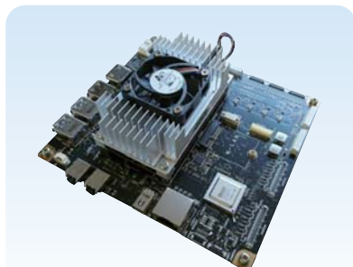
キャリアボード TX2i, TX2, TX1, TK1 モジュール全て接続可能