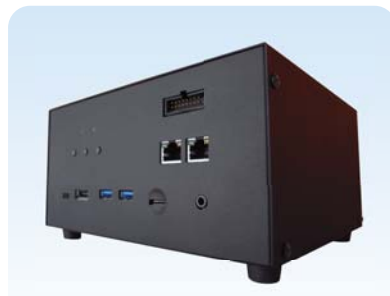
Xavier Edge white BOX 自社開発(参考出品)

※ NVIDIA, Xavier, Jetsonは、米国NVIDIA Corporationの米国およびその他の国における商標または登録商標です