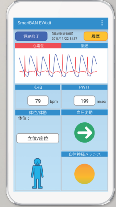
アプリケーション

※SmartBAN-EVakit、取扱説明書は、同梱しておりません。インターネットに接続してダウンロードしてください。 ※電極パッドの追加購入に関しては、お問い合わせください。 ご注意:充電用のmicroUSBケーブルは、同梱しておりません。ご購入者様でご用意ください。なお、動作確認済microUSBケーブルについては、お問い合わせください ご注意:本製品にスマートフォンは付属しておりません。ご購入者様でご用意ください。なお、動作確認済端末については、お問い合わせください ※スマートフォンの画面は、はめ込み合成です。